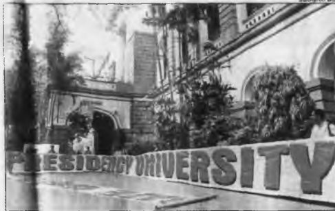
A banner celebrates Presidency College's new status

teachers, affiliated to CPM, feared losing their hegemony and strongly opposed the move. Gradually, however, the ranks of the dis-